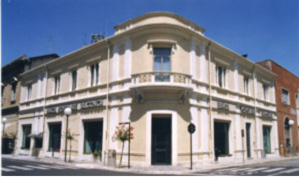
Storica sede della Bpv