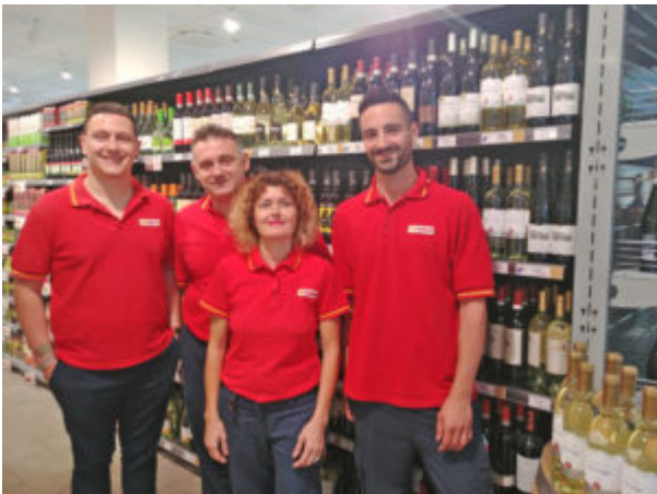
Misano, soci Conad

14.6.2019. Riapre Conad Spesa Facile il 14 giugno. Completamente ex novo nella stessa sede precedente, il negozio mantiene l'insegna Conad Spesa Facile, offre un'area vendita di circa 250 mq e utilizza impianti frigoriferi a CO2 per ridurre l'impatto ambientale; sempre per un contenimento dei consumi energetici è stata inoltre fatta la scelta di ricorrere a frigoriferi chiusi. Tra le novità si segnalano le casse automatiche, per una spesa veloce e con riduzione dei tempi di attesa. Le persone occupate nel punto vendita sono circa una decina.