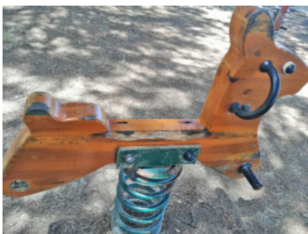
L'angolo frastagliato pericoloso