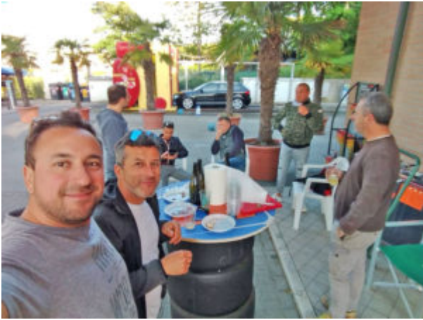
Foto di gruppo con aperitivo