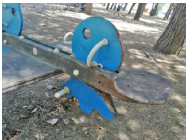
La seduta è una tagliola