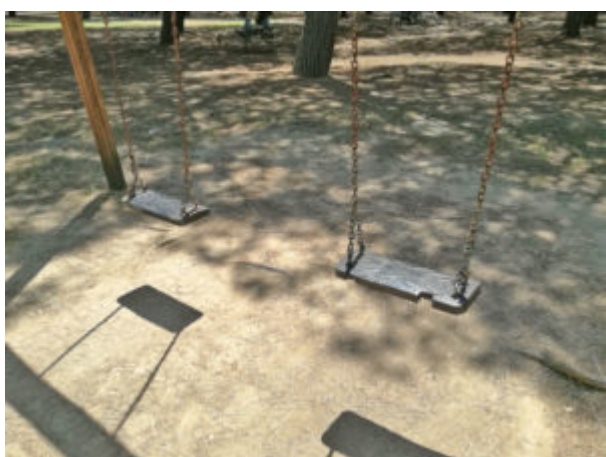
Altalena con seduta sbeccata e senza tappeti assorbi-caduta