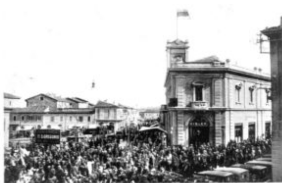
Morciano di Romagna - Fiera di S. Gregorio

Fiera San Gregorio 2020, preparazione sospesa fino al primo marzo.