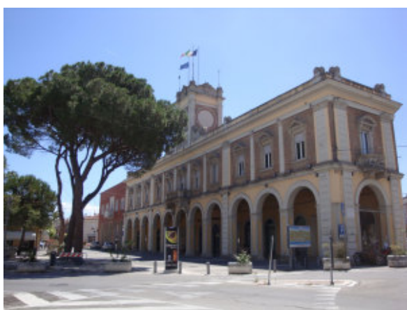
Morciano. Palazzo comunale

Il sindaco Giorgio Ciotti: “Sospetto Coronavirus, attenzione agli allarmismi sul nome morcianese”. “In merito alle notizie diffuse inerenti l’individuazione di un caso sospetto residente a Morciano si sottolinea che ciò non è confermato. Si sottolinea la necessità di attenersi a notizie ufficiali al fine di non ingenerare inutili e dannosi allarmismi”.