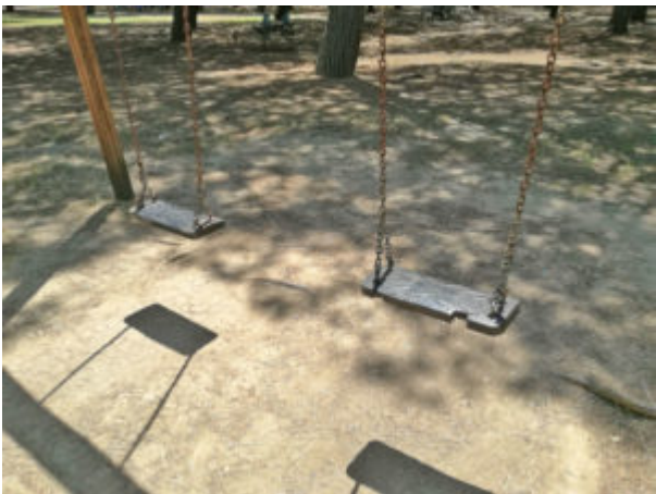
Altalena con seduta sbeccata e senza tappeti assorbi-caduta