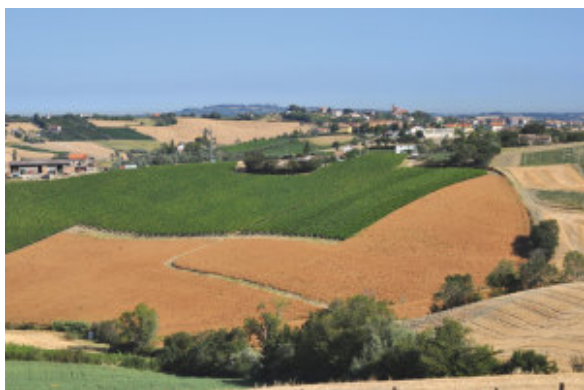
Coriano. Colline riminesi con vigneti

Almeni, presente anche i vini del Riminese. Dal mare e dai porti, dalle aie e dai poderi, dai castelli e dalle masserie tutte le eccellenze enogastronomiche a km zero si danno appuntamento attorno al circo di Almeni dove quest'anno la Strada dei Vini e dei Sapori dei Colli di Rimini inaugura un