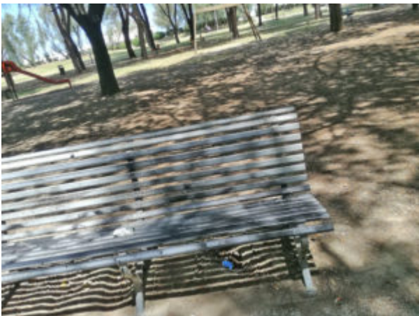
Panchine di metallo brutte ma resistenti alle intemperie

21 giugno 2019. Il Parco Mare Nord è una meraviglia. Direttamente sul mare, adulto, è una pineta impreziosita da alcune querce. E' in uno stato di avanzato ed annoso abbandono. I giochi sono delle tagliole. Gli angoli delle sedute dei giochi a molla sono consumati e seghettati. La seduta di plastica dell'altalena è nelle stesse condizioni. Sotto i vari elementi mancano i tappetini assorbiti cadute. Insomma, avrebbe bisogno di urgente manutenzione. E' misanese tra i massimi progettisti di giochi per esterni d'Italia. Chi scrive molte volte aveva fatto il suo nome agli amministratori, ma sempre ignorato. Era disposto a fare progetti di aree-gioco gratis nel nome dell'appartenenza ad una comunità. Avrebbe bisogno di una robusta potatura e disboscamento anche il parco. Durante la campagna elettorale, i misanesi hanno chiesto, in tutte le frazioni, più