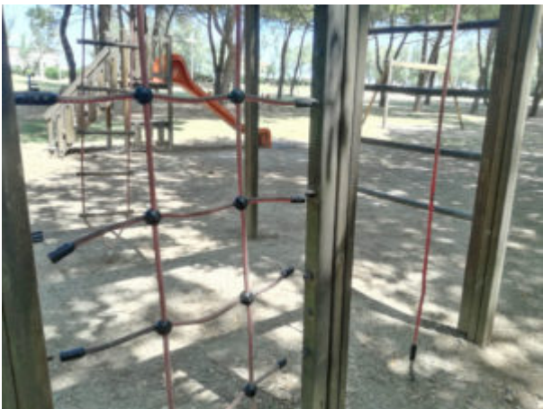
Arrampicata spezzata in più punti