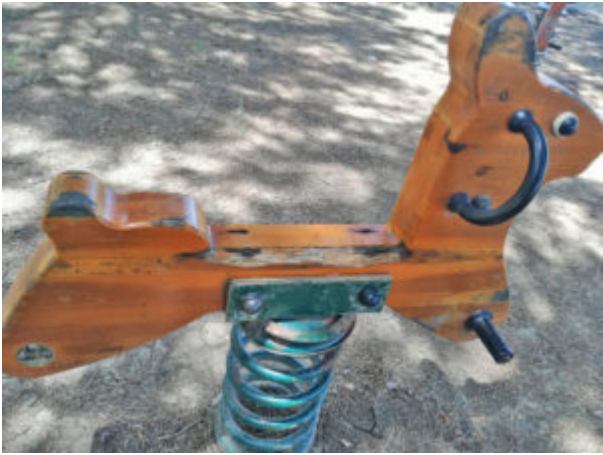
L'angolo frastagliato pericoloso