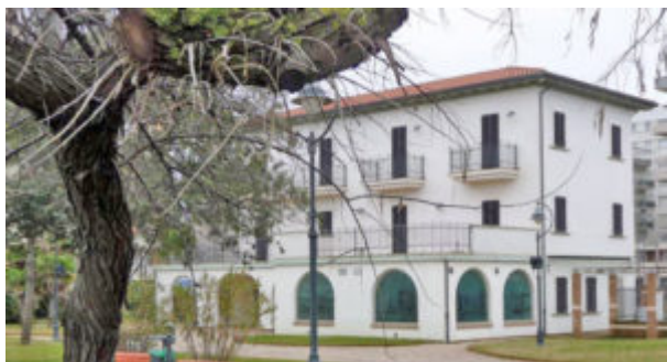
Villa Mussolini con giardini

Nei giardini di Villa Mussolini: mostre, musica, food e bollicine e il primo appuntamento con la rassegna di letture animate "In giardino... tante storie!". Il 1° maggio come da tradizione è dedicata al pic-nic che a Riccione non può che essere fronte mare. Da mattina a sera mostre, letture animate per i più piccoli, food e bollicine grazie all'anteprima di VSQ, Vini Spumanti di Qualità.