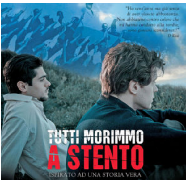
La locandina del film