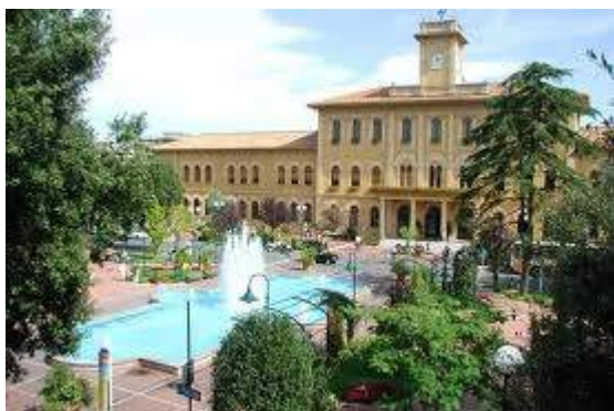
Cattolica, palazzo comunale