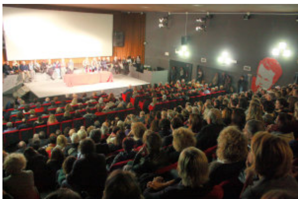
Teatro pieno per Michela Marzano

La raffinata intellettuale Michela Marzano ha chiuso con un bagno di folla l'ultimo appuntamento con Terre del futuro lo scorso 24 novembre al teatro Astra di Misano. "Amore", il suo tema. "La sua grandezza, afferma la celebre filosofa, sta nel fatto che ci regala un sentimento di libertà: essere noi