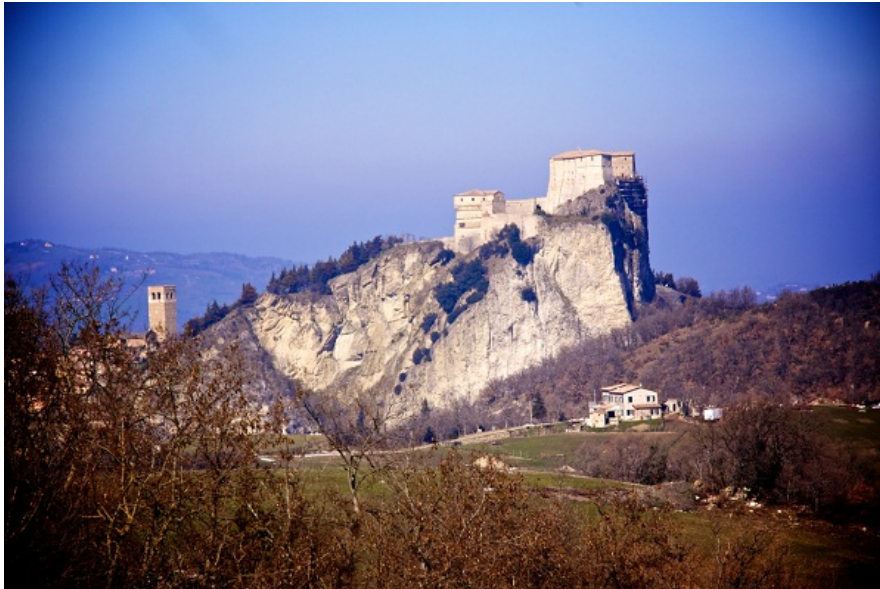
TERIITORIO Una suggestiva immagine di San Leo